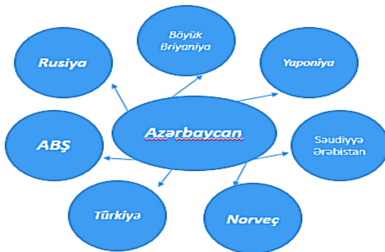
Qrafik göstərici şəkil 1

Şəkildə təqdim olunan ölkələrin ikisi dünyanın ən qlobal gücə malik olan dövlətlərindən biri olan ABŞ və Rusiya, digər ikisə isə Avropa İttifaqının üzvü və aparıcı ölkələrindən olan Norveç və Böyük Britaniya, biri şərqin aparıcı ölkəsi olan Yaponiya, digər qonşu ölkə olan Türkiyə və sonda isə neft hasilatında birinci olan Səudiyyə Ərəbistan.