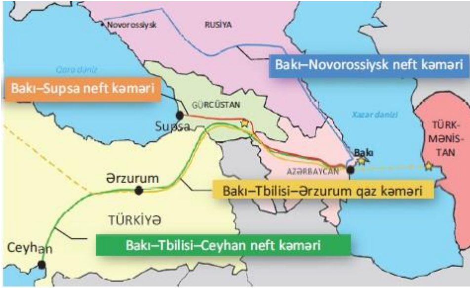
Şəkil 3. Azərbaycanın ixrac boru kəmərləri.