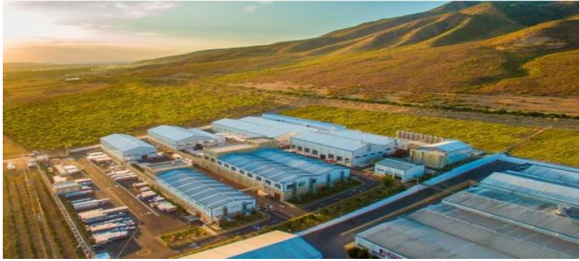
Şəkil 2. “Az-Granata” MMC, Ağsu rayonu

Aqrar inkişaf perspektivli dağlıq və düzənlik ərazilərdə kənd təsərrüfatı sahələrinin sahələrinin inkişafında təbii-coğrafi amillərin rolunun öyrənilməsi, yeni şəbəkələrinin yaradılması üçün əlverişli imkan və istiqamətlərin müəyyənləşdirilməsi müvafiq elmi-praktiki təkliflərin hazırlanması əsas iqtisadi-coğrafi problemlərdir.